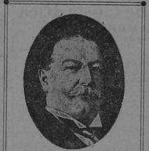
MR. TAFT, Presidente de los Estados Unidos

Anécdota entre Roosevelt y Taft Washington, 4.—Fueron tempestad de nieve barrió toda la costa Atlántica interrumpiendo la comunicación telegráfica y ferroviaria. Esta mañana, cuando Taft y Roosevelt se encontraron en el comedor de la casa Blanca, Taft le dijo a Roosevelt: «Señor Presidente: hablemos de los elementos de la naturaleza que protestan contra mi elección». Roosevelt le contestó: «Yo sabía que iba a ser una verdadera tempestad hasta el